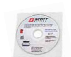
SOFTWARE DE CONFIGURACIÓN PROTÉGÉ ZM